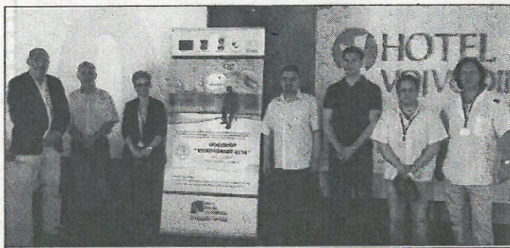
Пројектни тим „Envirobanat 2014.“

- Заједнички пројекат је завршен и задовољни смо оним што је постигнуто заједно са колегама